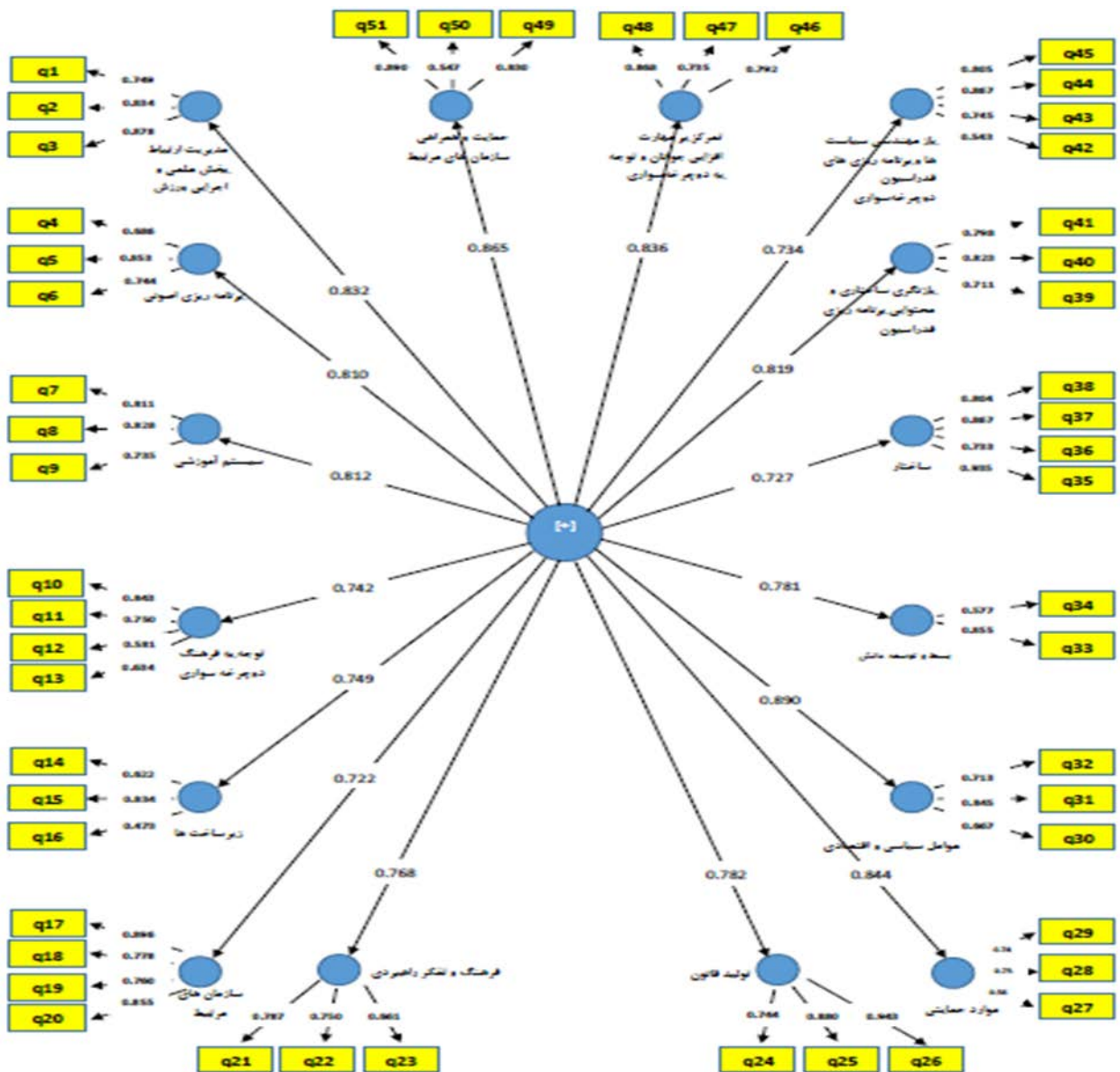
شکل ۳. مقادیر ضرایب استاندارد (β) ساختار عاملی عوامل شانزده گانه پرسشنامه در تحلیل عاملی تأییدی