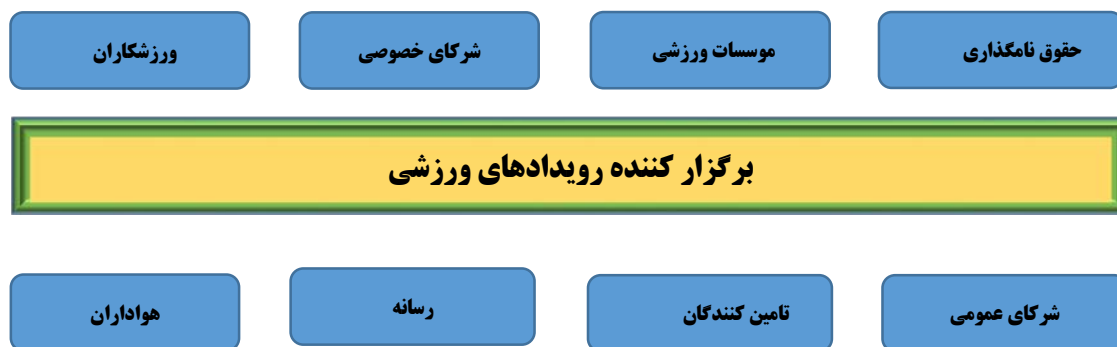
شکل ۳. قلمرو زیست‌بوم ورزشی (مالتز و دانگلا، ۲۰۱۶)

این سه مدل پایه به‌نوعی بیان می‌کند که ارکان این اکوسیستم دولت و سازمان‌های دولتی، مراکز آموزشی رسمی و غیررسمی، شرکت‌های بزرگ، سازمان‌های ورزشی، حمایتگر و انجمن‌های رسمی و غیررسمی، رسانه‌ها، مراکز رشد و شتاب‌دهنده‌ها و سرمایه‌گذاران و بانک‌ها در عرصه ورزش هستند.