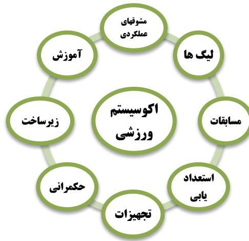
شکل ۱. قلمرو زیست‌بوم ورزشی KPMG

براساس الگوی تکامل‌یافته روند و گاتفریدسون ۱ در سال ۲۰۱۵ قلمرو زیست‌بوم ورزشی در شکل ۲ ملاحظه می‌شود که گویای اکوسیستمی پیچیده و پویاست.