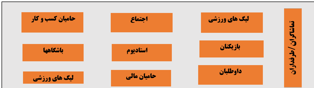
شکل ۲. قلمرو زیست‌بوم ورزشی KPMG

براساس الگوی تکامل‌یافته روند و گاتفریدسون ۱ در سال ۲۰۱۵ قلمرو زیست‌بوم ورزشی در شکل ۲ ملاحظه می‌شود که گویای اکوسیستمی پیچیده و پویاست.