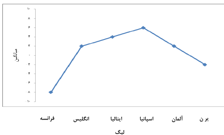
ب) مقایسه تأثیر بلندمدت تغییر مربی در لیگ برتر ایران با لیگ های اروپایی (۲۰ بازی) شکل ۱ - مقایسه تأثیر بلندمدت (۲۰ بازی) و کوتاه مدت (۲ بازی) تغییر مربی بر عملکرد تیم در لیگ برتر فوتبال ایران با لیگ های اروپایی

شکل ۱ مقایسه تأثیر بلندمدت و کوتاه مدت تغییر مربی بر عملکرد تیم در لیگ برتر فوتبال ایران با لیگ های اروپایی را نشان می دهد. به منظور کاهش تعداد نمودارها در قسمت تأثیر بلندمدت فقط نمودار مربوط به ۲۰ بازی بعد و قبل از تغییر مربی و در قسمت کوتاه مدت فقط نمودار مربوط به دو بازی بعد و قبل از تغییر مربی