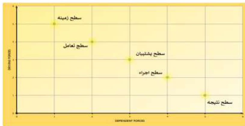
شکل ۲. میزان نفوذ و وابستگی سطوح خصوصی سازی باشگاه‌های ورزشی عراق

برای بررسی روابط الگوی مفهومی خصوصی سازی باشگاه‌های ورزشی عراق از مدلسازی معادلات ساختاری استفاده شد، که مدل استاندارد آن در شکل ۳ قابل مشاهده است.