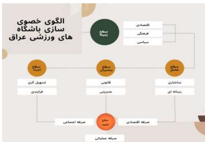
شکل ۱. الگوی مفهومی خصوصی سازی باشگاه های ورزشی عراق

پس از تعیین روابط و سطح بندی سطوح موصوف الگوی زیر در ارتباط با خصوصی سازی باشگاه های ورزشی عراق حاصل شد. بر مبنای این الگو و روابط بین متغیرها، خصوصی سازی باشگاه های ورزشی در عراق تابع پنج سطح است، در پایین ترین سطح عوامل زمینه ساز قرار دارد و در بالاترین سطح به عنوان خروجی سیستم سطح نتیجه قرار دارد. نحوه تعامل این سطوح (بنابر ماتریس خودتعاملی ساختاری) و اجزای آن در شکل ۱ نمایش داده شده است.