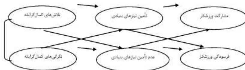
شکل ۱. چهارچوب مفهومی پژوهش

جلوگیری کند. موفقیت ورزشی نیز که معیار مهم و اصلی تمام ورزشکاران قهرمان است، می‌تواند بر اهمیت و ضرورت انجام این تحقیق بیفزاید. همچنین نتایج این تحقیق مورد استفاده مربیان و ورزشکاران و روان‌شناسان ورزشی قرار می‌گیرد.