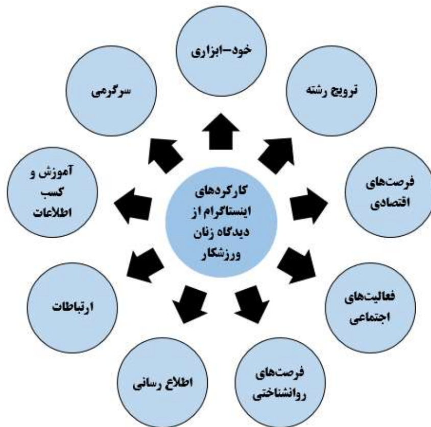
شکل ۱. کارکردهای اینستاگرام از دیدگاه زنان ورزشکار ایرانی