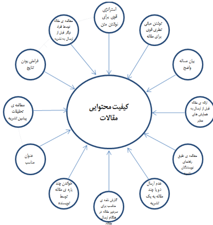
شکل ۳. استخراج کد اولیه سؤال سوم