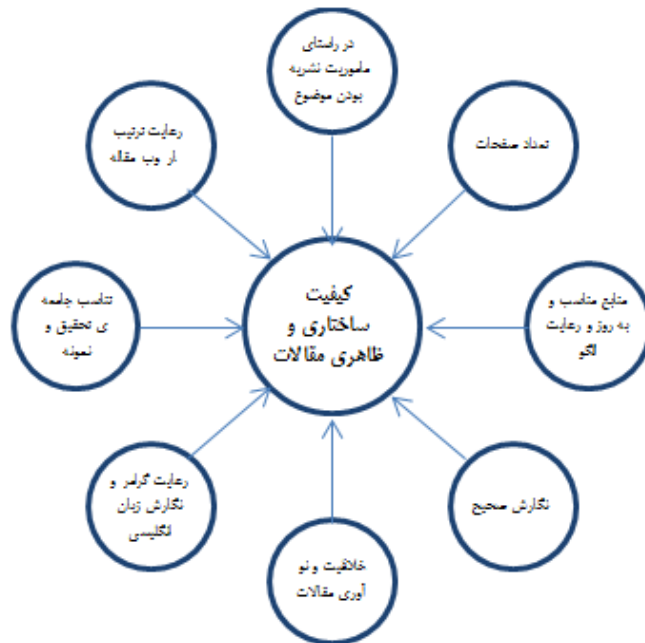
شکل ۱. استخراج کد اولیه سؤال اول