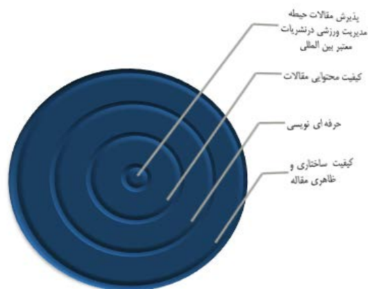
شکل ۴. کدگذاری انتخابی