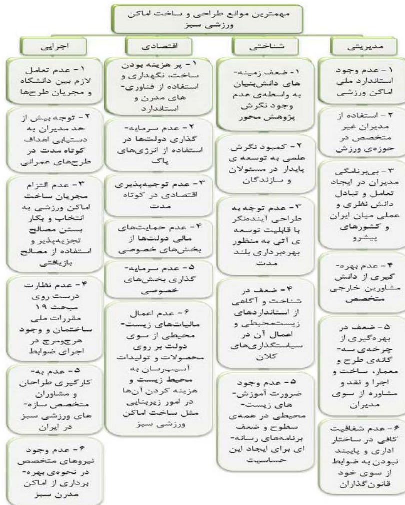
شکل ۵. درخت سلسله‌مراتبی عامل‌های اصلی و زیرمعیارها