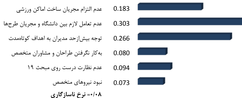
شکل ۴. وزن‌دهی زیرمعیارهای عامل اجرایی

طبق جدول ۵ و شکل ۴، با توجه به وزن اصلی به‌دست‌آمده به‌ترتیب مؤلفه‌های عدم تعامل لازم بین دانشگاه و مجریان طرح‌ها، توجه بیش‌ازحد مدیران به دستیابی اهداف کوتاه‌مدت در طرح‌های عمرانی، عدم التزام مجریان ساخت اماکن ورزشی به انتخاب و به‌کار بستن مصالح تجزیه‌پذیر و استفاده از مصالح بازیافتی، عدم نظارت درست روی مبحث ۱۹ مقررات ملی ساختمان و وجود هرج‌ومرج در اجرای ضوابط، به‌کار نگرفتن طراحان و مشاوران متخصص سازه‌های ورزشی سبز در ایران و نبود نیروهای متخصص در نحوه بهره‌برداری از اماکن مدرن سبز از بیشترین و کمترین اهمیت در گروه برخوردارند. از طرفی با توجه به اینکه نرخ ناسازگاری عدد ۰/۰۸ به‌دست آمده که کوچک‌تر از حد استاندارد ۰/۱ است، از این رو پرسشنامه مذکور با دقت بالا توسط پاسخ‌دهندگان تکمیل شده است.