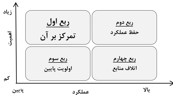
نمودار ۱. ماتریس اهمیت-عملکرد

روش پژوهش حاضر از نظر هدف کاربردی و از نظر روش انجام کار در زمره پژوهش‌های توصیفی - پیمایشی است. مدل مورد استفاده در این پژوهش، مدل تحلیل اهمیت-عملکرد (IPA) است. در این مدل از طریق تشکیل ماتریس دویعدی که محور عمودی آن ادراک مشتریان از عملکرد (کیفیت) هر عامل و محور افقی آن اهمیت آن عامل از دید مشتریان را نشان می‌دهد، می‌توان پیشنهادهای مؤثر و کاربردی را برای مدیران ارائه کرد. تحلیل‌ها بر اساس محل قرار گرفتن عوامل در هر یک از مناطق این ماتریس به شرح زیر انجام می‌گیرد (نمودار ۱).