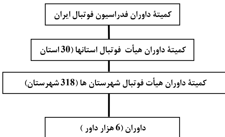
شکل 1- تشکیلات داوری فوتبال در ایران

تشکیلات داوری فوتبال در ایران به کمیته داوران فدراسیون فوتبال و واحدهای استانی و شهرستانی زیرمجموعه آن محدود می‌شود، در حالی که تشکیلات داوری فوتبال در انگلستان شامل دو بخش مجزا با واحدهای مختلف است (کمیته داوران اتحادیه فوتبال انگلستان، اتحادیه داوران). واحدهای مختلف کمیته داوران اتحادیه فوتبال انگلستان و اتحادیه داوران انگلستان در شکل‌های 2 و 3 آمده است. عدم تطابق تشکیلات داوری فوتبال در ایران و انگلستان با مقایسه شکل‌های 1، 2 و 3 آشکار می‌شود که حاکی از تنوع و گستردگی بیشتر تشکیلات داوری انگلستان نسبت به ایران است (18).