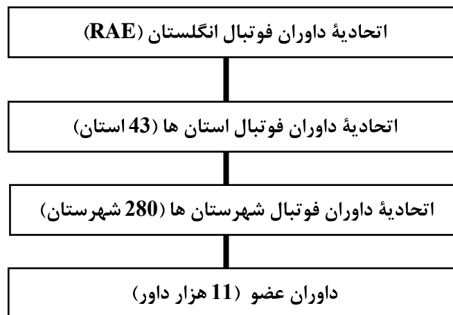
شکل 2 - تشکیلات اتحادیه داوران فوتبال انگلستان