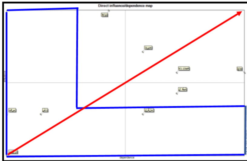
نمودار ۲. پراکنندگی عوامل زیرساخت فناوری اطلاعات

در تحلیل پلان براساس پراکنش متغیرها دو سیستم پایدار و ناپایدار وجود دارد که در سیستم پایدار پراکنش به صورت L انگلیسی نشان داده می‌شود، به این معنی که متغیرها تأثیرگذاری و تأثیرپذیری بالایی دارند. نمودار ۲ نشان‌دهنده وضعیت پراکنش متغیرهاست.