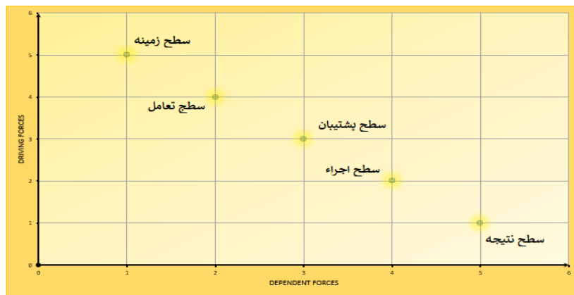
شکل ۲. میزان نفوذ و وابستگی سطوح خصوصی سازی باشگاه‌های ورزشی عراق

برای بررسی روابط الگوی مفهومی خصوصی سازی باشگاه‌های ورزشی عراق از مدل سازی معادلات ساختاری استفاده شد، که مدل استاندارد آن در شکل ۳ قابل مشاهده است.