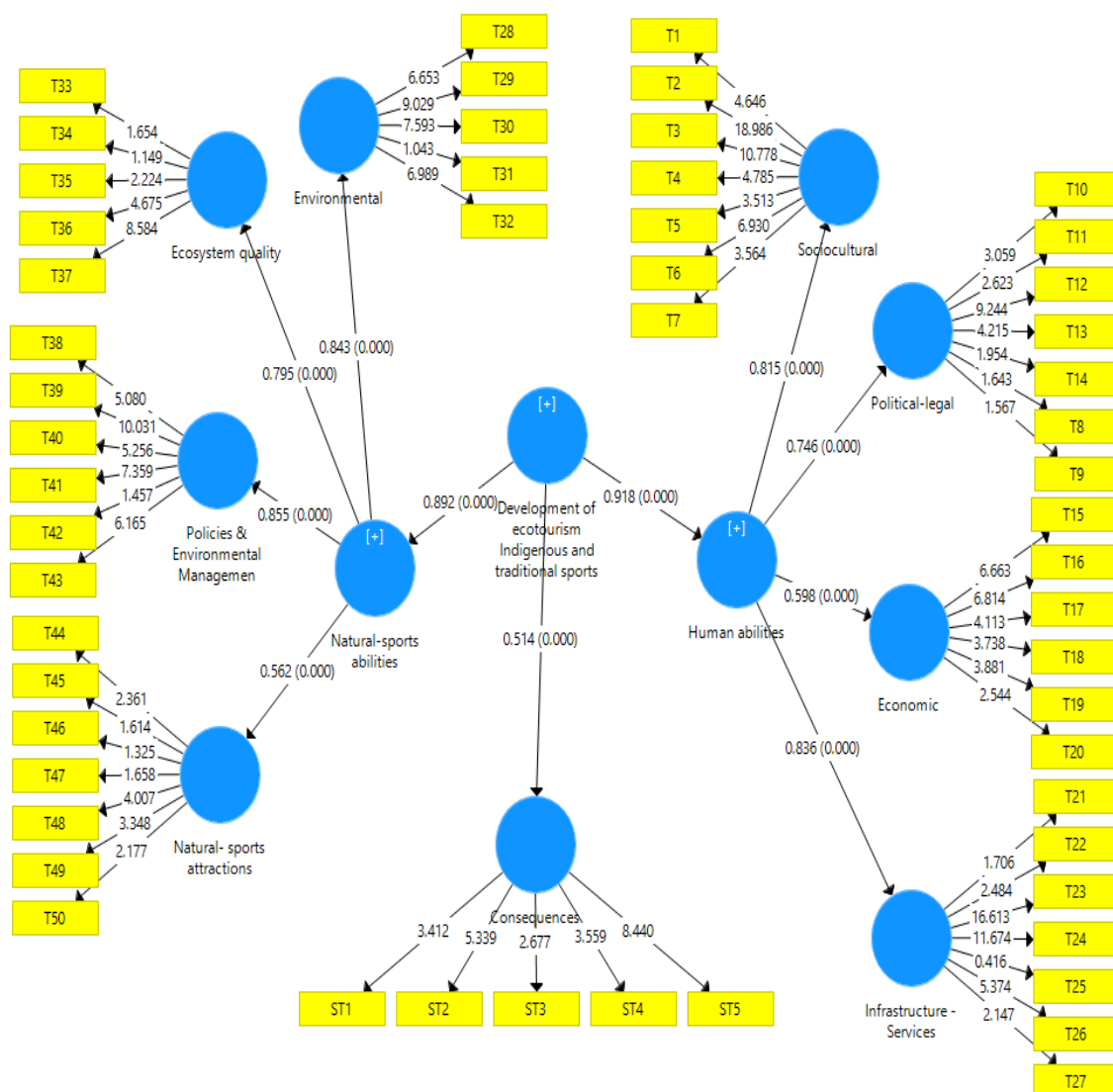
شکل ۱. ضرایب مسیر و بار عاملی سازه‌ها در حالت t-value

تحلیل مسیر الگوی پژوهش نشان داد که دو بعد پتانسیل‌های طبیعی - ورزشی با ضریب مسیر (۰/۸۹) و پتانسیل‌های انسانی با ضریب تأثیر (۰/۹۱) تبیین‌کننده‌های توانمندی برای توسعه گردشگری ورزش‌های بومی و سنتی استان گلستان هستند. همچنین در بعد پتانسیل‌های طبیعی - ورزشی سازه مدیریت محیط زیست (۰/۸۵) و جاذبه‌های زیست‌محیطی (۰/۸۴) از بالاترین ضریب مسیر برخوردار بودند. در بعد توانمندی‌های انسانی نیز سازه زیرساخت‌ها با ضریب مسیر (۰/۸۳) و سازه اشتراکات فرهنگی - اجتماعی با ضریب مسیر (۰/۸۱) بیشترین ضریب مسیر را به خود اختصاص دادند (شکل ۲).