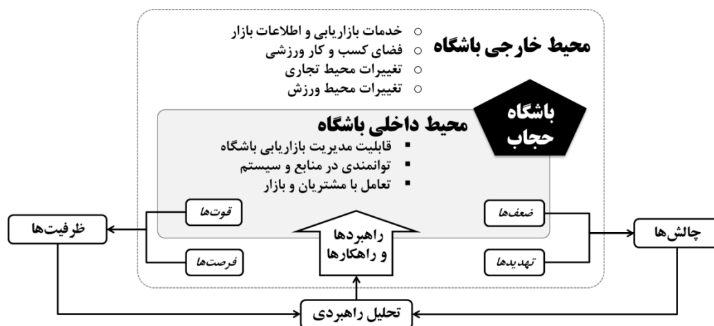
شکل ۱. چارچوب تحلیل مفهومی پژوهش

با توجه به مرور مطالعات قبلی، ایجاد و توسعه کسب و کارهای مرتبط با باشگاه‌های ورزشی، منابع جدید ثروت را تولید می‌کنند و فرصت‌های جدید کسب و کاری را منجر می‌شوند. همچنین بالا بردن مشارکت در باشگاه‌های ورزشی، تعداد افرادی که به‌طور مستقیم در کارآفرینی درگیرند، افزایش داده و تلاش‌های کارآفرینانه را نیز ارتقا می‌دهد. از این رو مشخص کردن عوامل مهم ایجاد کسب و کارهای ورزشی (مثل تجربه قبلی صاحبان باشگاه‌های ورزشی که در زمینه ورزش کار کرده‌اند) می‌تواند قبل از ایجاد آنها، به شروع کنندگان شناخت خوبی دهد و آنها را در جهت موفقیت و حمایت در ایجاد، کمک کند. از این رو می‌توان گفت که اقدام این تحقیق در خصوص بازاریابی راهبردی ورزشی خواهد توانست گام مهمی در جهت ایجاد آگاهی‌های لازم برای متصدیان باشگاه‌های ورزشی بردارد. از این رو تحقیق حاضر درصدد پاسخگویی به این پرسش است که موقعیت راهبردی بازاریابی باشگاه آمادگی جسمانی حجاب شهر تهران چگونه است؟