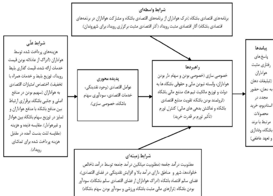
شکل ۲. مدل پارادایمی پژوهش

در کدگذاری باز، گروه پژوهش به پدید آوردن مقوله‌ها و ویژگی‌های آنها می‌پردازد و سپس می‌کوشد مشخص کند که چگونه مقوله‌ها در طول ابعاد تعیین‌شده تغییر می‌کند. در کدگذاری محوری، مقوله‌ها، نظام‌مند بهبود می‌یابد و با زیرمقوله‌ها پیوند داده می‌شود. با این حال، اینها هنوز مقوله‌های اصلی نیست که در نهایت برای تشکیل آرایش نظری بزرگ‌تر یکپارچه شود، فرایند یکپارچه‌سازی و کدگذاری گزینشی به‌طوری‌که نتایج پژوهش شکل نظریه پیدا کند، بهبود مقوله‌هاست که مفاهیم و مقوله‌های استخراج‌شده از داده‌های پژوهش در جدول ۲ مشخص شده است. کدگذاری گزینشی، مرحله اصلی نظریه‌پردازی داده‌بنیاد است که محقق براساس نتایج کدگذاری باز و محوری به ارائه نظریه می‌پردازد.