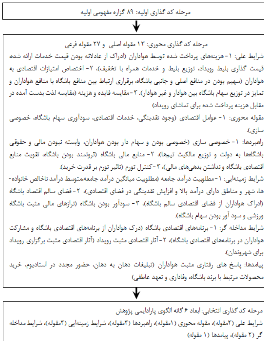
شکل ۲. فرایند مدیریت داده‌ها در سه مرحله کدگذاری

فرایند تحلیل و نامگذاری مفاهیم، طبقه‌بندی و کشف ویژگی‌ها و ابعاد آنها در داده‌ها از طریق انجام مقایسه‌ای مداوم است. در این پژوهش مصاحبه‌ها با استفاده از روش تحلیل محتوا سطر به سطر بررسی،