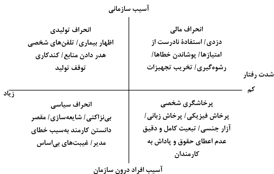
شکل ۱. طبقه‌بندی رفتارهای انحرافی

نوع‌شناسی رفتارهای انحرافی کارکنان برای توسعه مطالعات سیستماتیک در این زمینه مفید است و ما را قادر می‌سازد که به تئوری جامعی در مورد آنها دست یابیم. بنت و رایبسون با استفاده از دو بعد شدت رفتار و نوع آسیبی که این رفتار بر جای می‌گذارد، رفتارهای انحرافی را به چهار دسته اصلی تقسیم کرده‌اند: انحراف تولیدی ۱ (فعالیت‌هایی که مستقیماً به تولید آسیب می‌زنند، مثلاً مطالعه روزنامه به جای کار کردن)، انحراف مالی ۲ (تخریب یا استفاده نامناسب از دارایی سازمان)، انحراف سیاسی ۳ (شایعه‌سازی برای سازمان) و پرخاشگری شخصی ۴ (پرخاش‌های فیزیکی) (۸). شکل ۱ این طبقه‌بندی را نشان می‌دهد (۳).